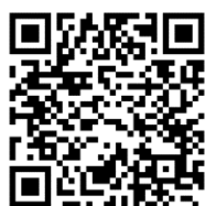
「空大 FB 臉書」