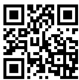
「空大 FB 臉書」